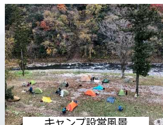
キャンプ設営風景