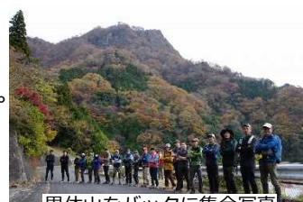
男体山をバックに集合写真